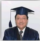
Autor: Ing. José Oñate B., Mg.

La cosmovisión es el conjunto del conocimiento de la realidad de cada persona que le permite saber evaluar y reconocer los diferentes aspectos que conforman la imagen o figura general del mundo o cultura, a partir del cual se interpreta la naturaleza y todo lo que existe.